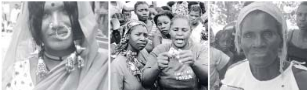
Image 1 : Professionnelle du sexe, Inde ; Image 2 : Formateur en lutte contre le VIH/SIDA faisant la démonstration de l'usage du condom, Mozambique ; Image 3 : Les communautés participent à l'inauguration des services du projet ACER, Zambie.