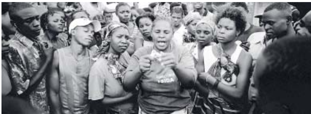
Formateur en lutte contre le VIH/SIDA faisant la démonstration de l'usage du condom, Mozambique